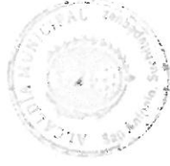
Edgar Mauricio Ovalle Siguan Alcalde Municipal

Edgar Mauricio Ovalle Siguan Para Servir