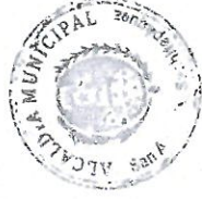
Edgar Mauricio Ovalle Siguán Alcalde Municipal